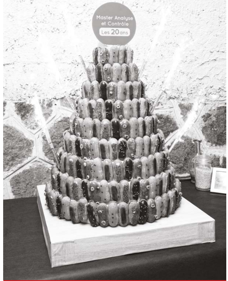
Le gâteau des 20 ans du Master Analyse & Contrôle

Depuis 2023, l'équipe dirigeante du Master a mis en place un plateau d'instrumentation de haut niveau dédié à la formation des étudiants. Il s'agit de la plus grande plateforme technique